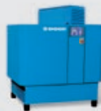
Schraubenkompressoren mit Frequenzregelung