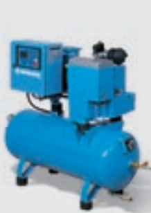
Schraubenkompressor mit Kompaktmodul