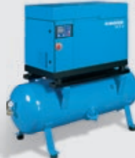
Schraubenkompressor mit Frequenzregelung