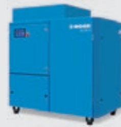
Schraubenkompressor mit Frequenzregelung und Einschubtrockner