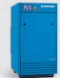
Kolbenkompressor TOP AIR