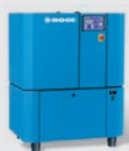
Schraubenkompressor mit integriertem Trockner